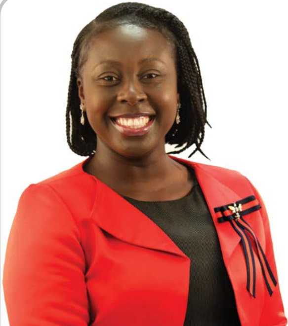
Amma Amparbeng Mukongomisinkulu wa Timali

Hlangana na Xipanunkulu xa MWPF lexi nga na vutihlamuleri eka xitirateji xa MWPF.